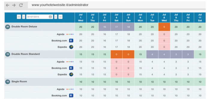
Channel Manager integrato